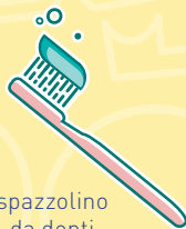
spazzolino da denti