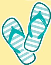
infradito da spiaggia