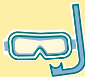
maschera sub e boccaglio