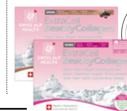
ExtraCell Beauty Collagen, Schokodrink, 20 Beutel, 79.10 statt de 98.90 ExtraCell Beauty Collagen, Drink mit roten Beeren und Vanille, 20 Beutel, 79.10 statt 98.90

Mikroernährung ist die Wissenschaft von Mikronährstoffen wie Vitaminen, Mineralien, Spurenelemente usw. und deren positiven Eigenschaften. Da der Körper diese Nährstoffe nicht selbst herstellt, stützt sich die Mikroernährung auf die Analyse unserer Ernährungsgewohnheiten, um Mängel festzustellen, Ratschläge zu geben und individuelle Ergänzungen auszuarbeiten. Die Förderung einer gesunden Darmflora (Darmmikrobiota) kann dazu beitragen, viele Probleme im Zusammenhang mit Verdauung, Müdigkeit und Erschöpfung zu verbessern. Lassen Sie sich bei Amavita beraten!