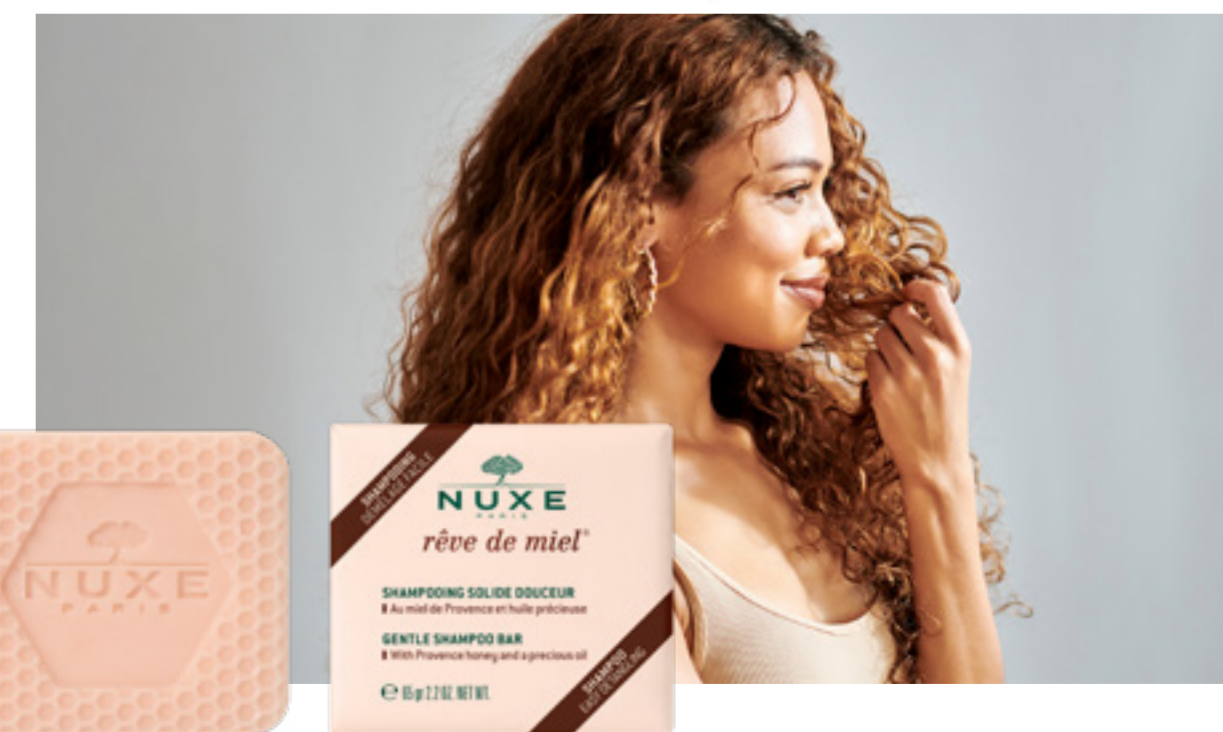
Amavita Meine Haut – Frühling 2024 | 7