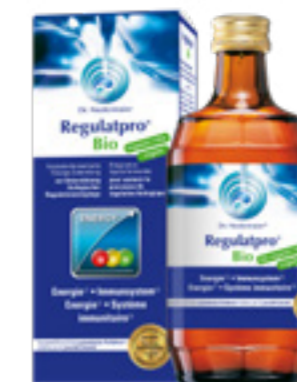
Regulatpro Bio, 350 ml, 50.35 statt 62.95