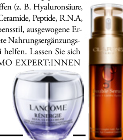
Lancôme, Rénergie H.P.N. 300-Ultra Cream, 50 ml, 155.- Clarins, Double Serum, 50 ml, 149.-

Eine Falte ist ein Bruch der Lederhaut, der durch wiederholte Bewegungen der Gesichtsmuskulatur, dem sinkenden Anteil an Hyaluronsäure, Kollagen und Elastin sowie durch Glykation entsteht. Glykation ist die «Verzuckerung» der Gewebefasern, die sich verhärtet und dann brechen. Rauchen, Alkohol, UV-Strahlen, Schlaf- und Flüssigkeitsmangel, Stress und eine Ernährung mit wenig Vitaminen und Antioxidantien fördern diesen Prozess. Doch Falten erzählen auch unser Leben. Akzeptieren wir sie, und verwöhnen wir lieber unsere Haut, damit sie gesund und möglichst lange schön bleibt. Pflegeprodukte mit Anti-Aging-Wirkstoffen (z. B. Hyaluronsäure, Retinol, Vitamin C, Ceramide, Peptide, R.N.A, AHA), gesunder Lebensstil, ausgewogene Ernährung und geeignete Nahrungsergänzungsmittel können dabei helfen. Lassen Sie sich von unseren Dermo-Expert:innen beraten.