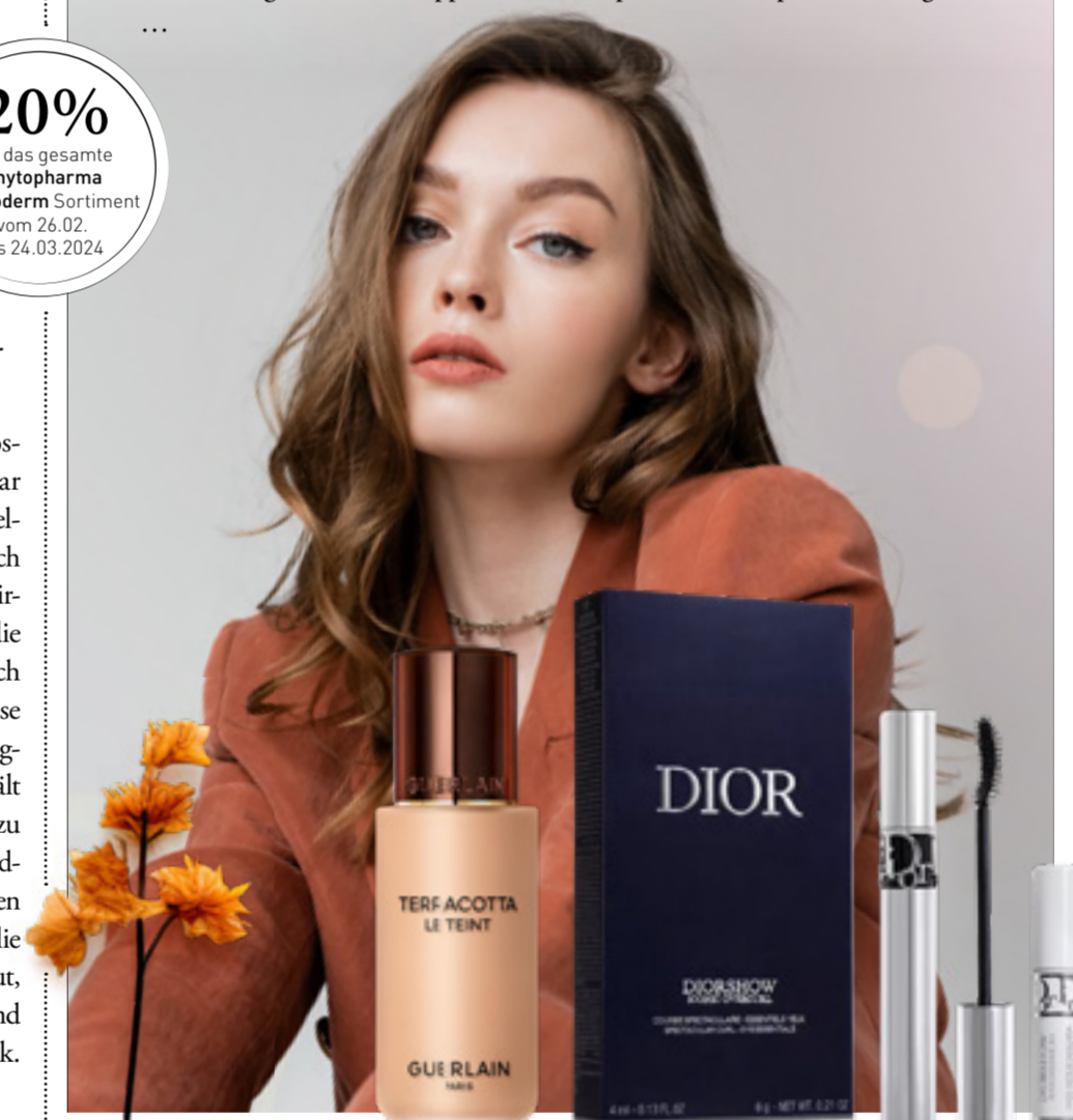
Guerlain, Terracotta Le Teint 3.5N, 73.95 | Dior, Diorshow Set, Iconic Overcurl, Eye Essentials, 84.95